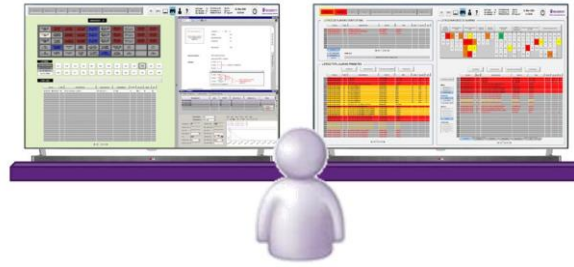
Figura 2. Interfaz del Gestor de Alarmas y Avisos de Tecnatom