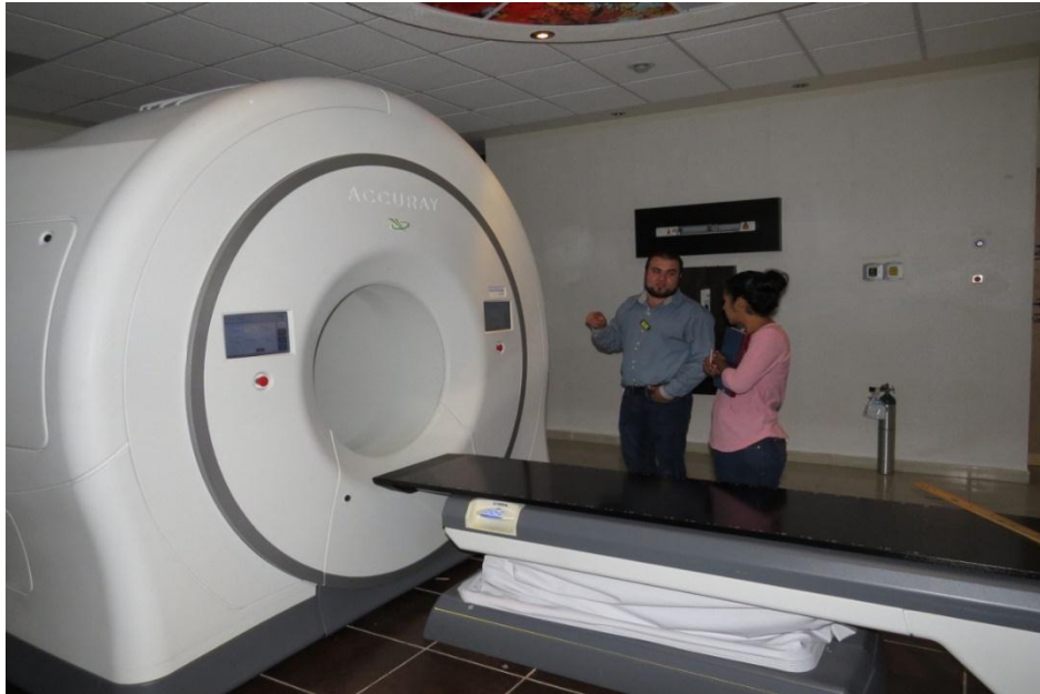
Figura 1. TomoLINAC Tomo Therapy HD de 6 MV

El estudio se realizó en la Unidad de Especialidad Médica de Oncología de Zacatecas (UNEME) que cuenta con un TomoLINAC de la marca Accuray modelo TomoTherapy HD que se muestra en la figura 1.